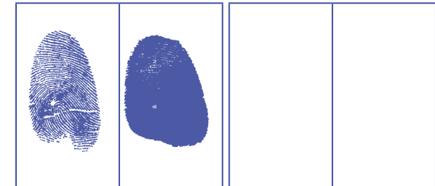
BUENA MALA IMPRESIONES DE PRÁCTICA (Manchado: se aplicó mucha presión) (Tocar suave y rápidamente)

Realice impresiones de practica en el área provista a continuación.